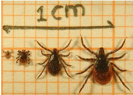
Van links naar rechts de larve, nimf, mannetje en het vrouwtje van de schapenteek

bedrijfsarts verwezen voor nader onderzoek naar het Lyme expertisecentrum. Daar vindt verder onderzoek plaats en indien nodig een behandeling gestart.