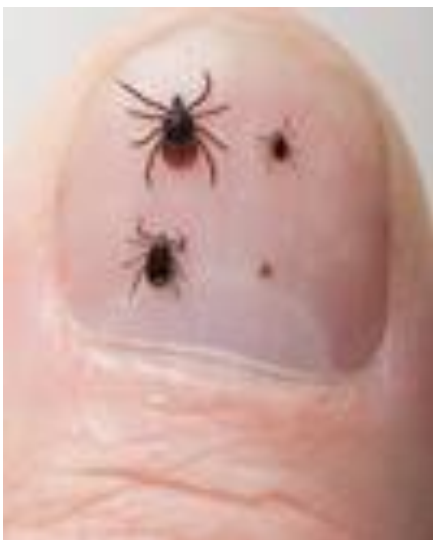
Teken op een duimnagel: van linksboven met de klok mee: volwassen vrouwtje, nimf, larve, volwassen mannetje. Foto's kunt u vinden bij het RIVM: voorlichtingsmateriaal tekenbeten en Lyme .

Een teek die zich net heeft vastgebeten is erg klein (niet groter dan 3 millimeter), donker gekleurd, plat, en is heel moeilijk dood te drukken. Pas na een paar dagen begint de teek op te zwellen.