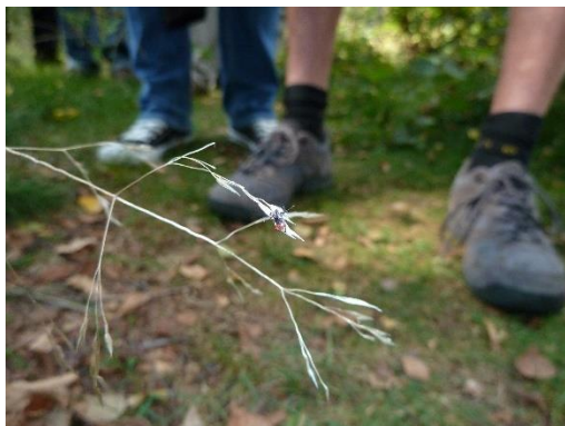
Teek op overhangende grasspriet, klaar een passerend been vast te grijpen

Misschien nog belangrijker is het vermogen tot risico-acceptatie en relativering. Het is goed te weten dat het gemiddelde groen geen 'tekenzee' is. Het aantal teken dat per 10 meter bospad klaar zit om zich vast te grijpen aan je broekspijp is vaak veel lager dan het aantal dat bijvoorbeeld met een wit laken gevangen wordt. In bossen vang je zo ongeveer 3 nimfen en volwassen teken per 10 m 2 , in de bebouwde kom ligt dat aantal ruwweg nog 10 keer lager. Dat zijn dan de teken die zich vastgrijpen aan een wit laken; het aantal dat zich aan de broekspijp vastgrijpt is nóg lager. Als je intensief met het groen in contact komt tijdens werk of recreatie, bijvoorbeeld door op het strooisel te knielen of te zitten, vergroot je natuurlijk de kans dat een teek overstapt. Hebben we het over de 'reuzenteek' die vorig jaar veel in het nieuws kwam is de trefkans nog véél lager: er werden er in heel Nederland maar een handvol gevonden. Natuurlijk is het wel belangrijk die ontwikkeling te volgen, maar het risico op een beet van deze teek ligt vooralsnog dichtbij nul.